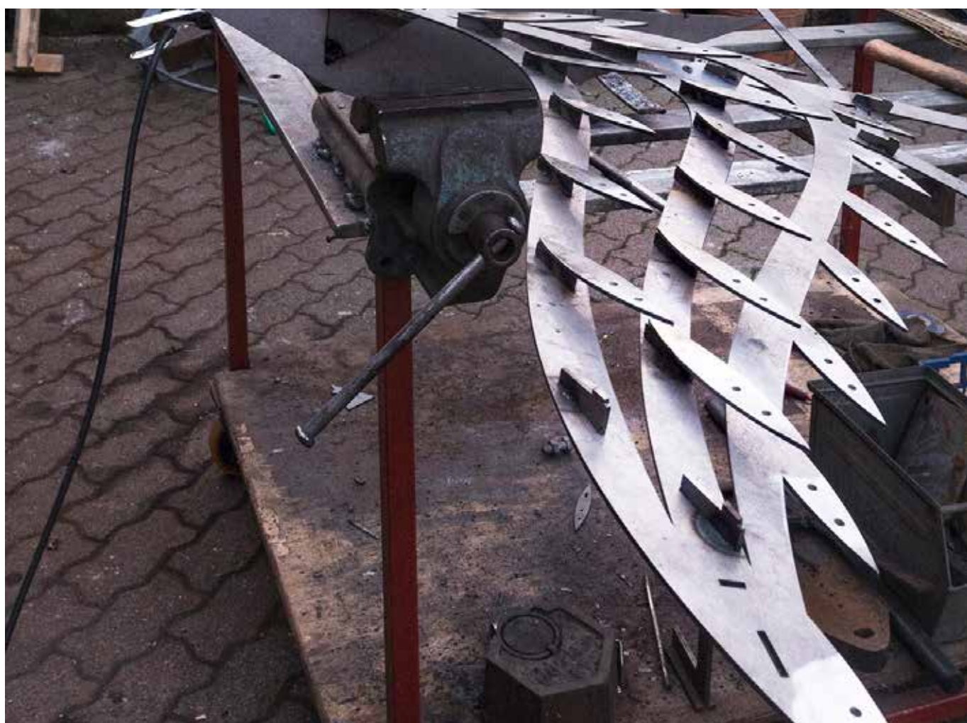
Alcune immagini della progettazione e lavorazione