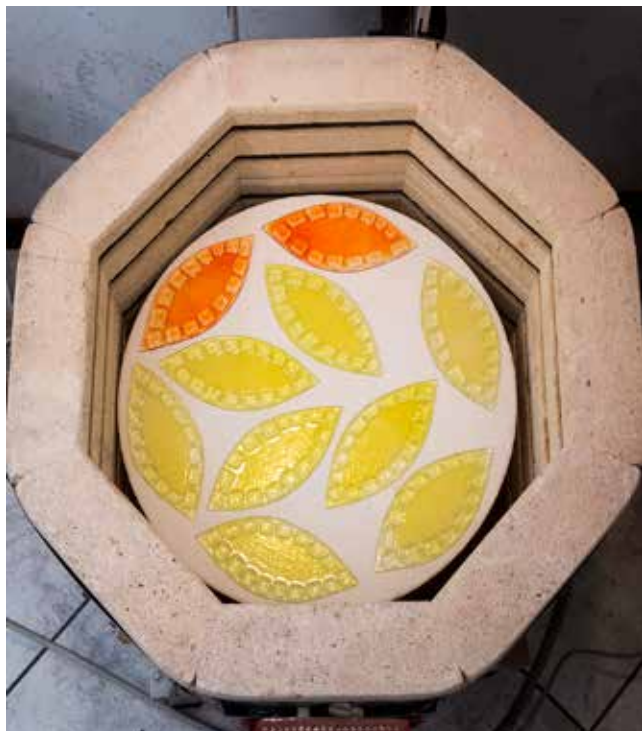
Alcune immagini della lavorazione

Non a caso l'opera rappresenta una FENICE (uccello sacro, con vivido piumaggio multicolore, a cui gli antichi attribuivano la peculiarità di rinascere dalle proprie ceneri).