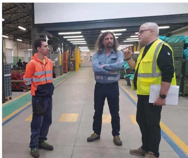
IL REVISORE CON IL PRESIDENTE E IL COORDINATORE DEL REPARTO DALMINE